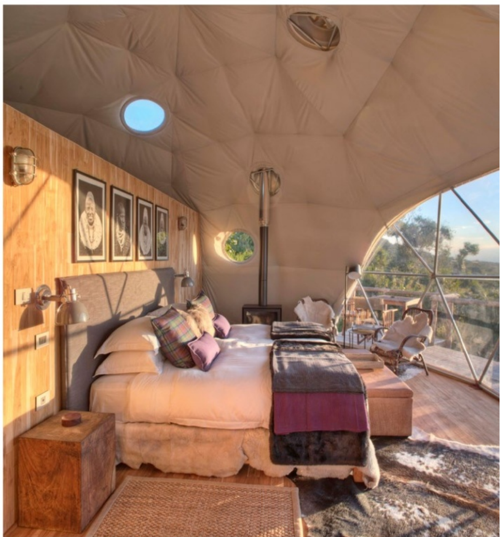
SP (X 2) - WWW.HAPUKULODGE.COM

A partir de 590 € la nuit, www.hapuku-lodge.com . 16 nuits dont 2 au Hapuku Lodge, à partir de 19 200 €/pers. (base 2), vols, transferts, locations de voiture, hébergements en hôtels de luxe, petits déjeuners, certains repas et activités inclus. 09.70.17.00.04, www.voyages-confidentiels.fr .