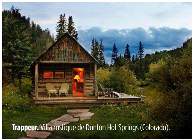
Trappeur. Villa rustique de Dunton Hot Springs (Colorado).