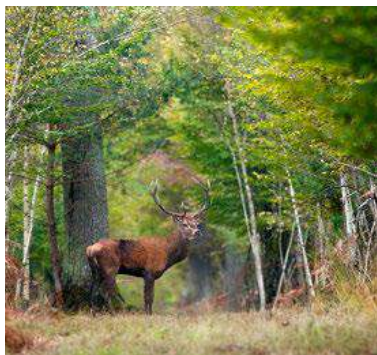
Faune. Au cœur de la forêt solognote.

Au vert. Balades nature en France ou hôtels insolites à l'autre bout du monde, tout pour se ressourcer en forêt. PAR MARION TOURS