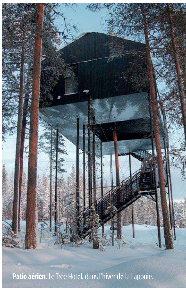
Patio aérien. Le Tree Hotel, dans l'hiver de la Laponie.

A partir de 590 € la nuit, www.hapukulodge.com .