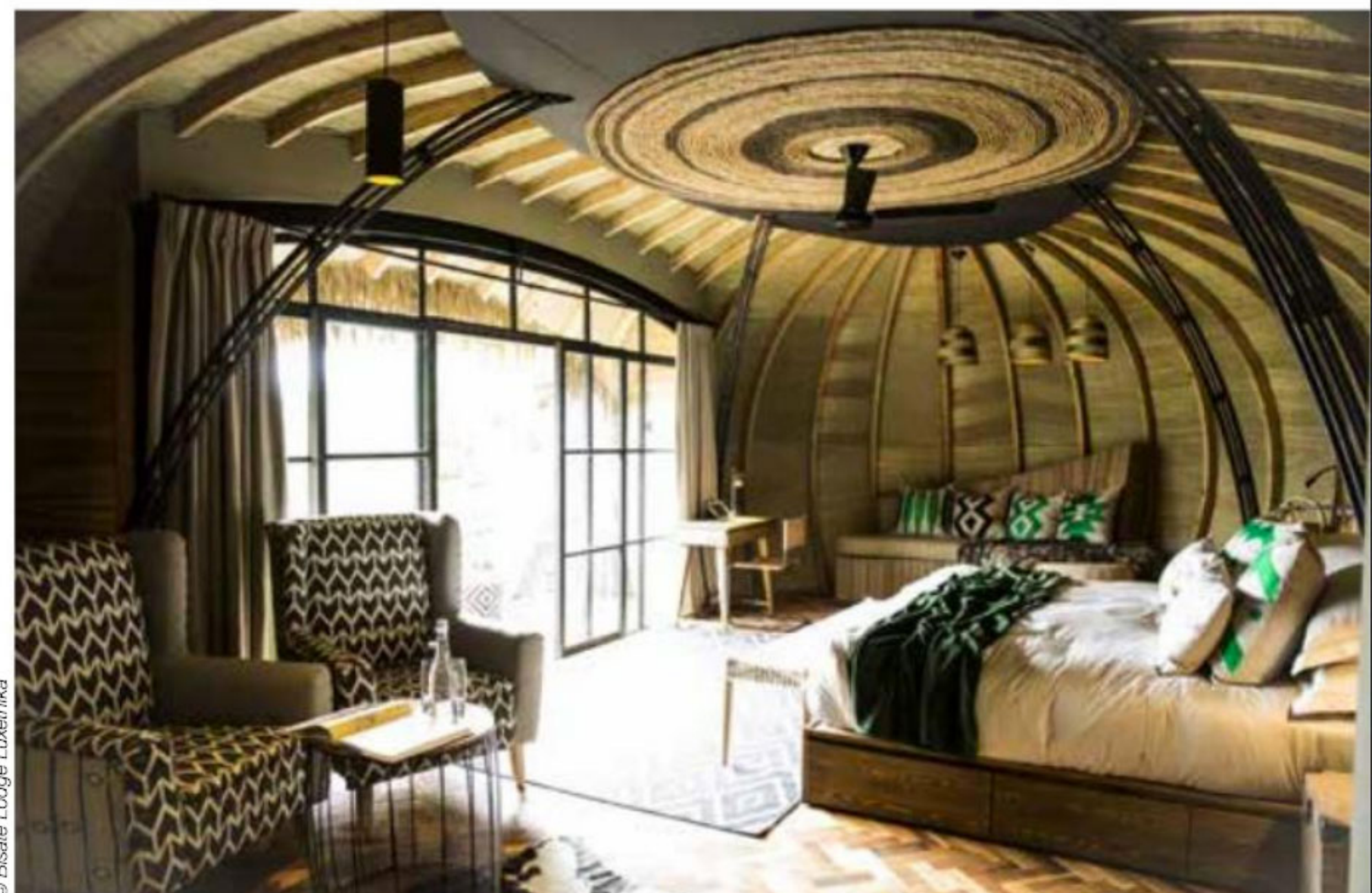
Grâce à une démarche éco-environnementale extrêmement poussée, luxe et écologie font bon ménage au Bisate Lodge.

Dans le monde du voyage et des très prisés safaris africains, les lodges les plus luxueux ont compris l'appétence de leurs hôtes pour les expériences uniques. Si les excursions à la rencontre des Big Five (lion, rhinocéros, éléphant, léopard et buffle) et autres girafes, sont naturellement à leur programme - et le luxe toujours au rendez-vous - ils ajoutent à la longue liste de leurs arguments une démarche éco-responsable, ou encore une architecture remarquable implantée dans des lieux profondément atypiques.