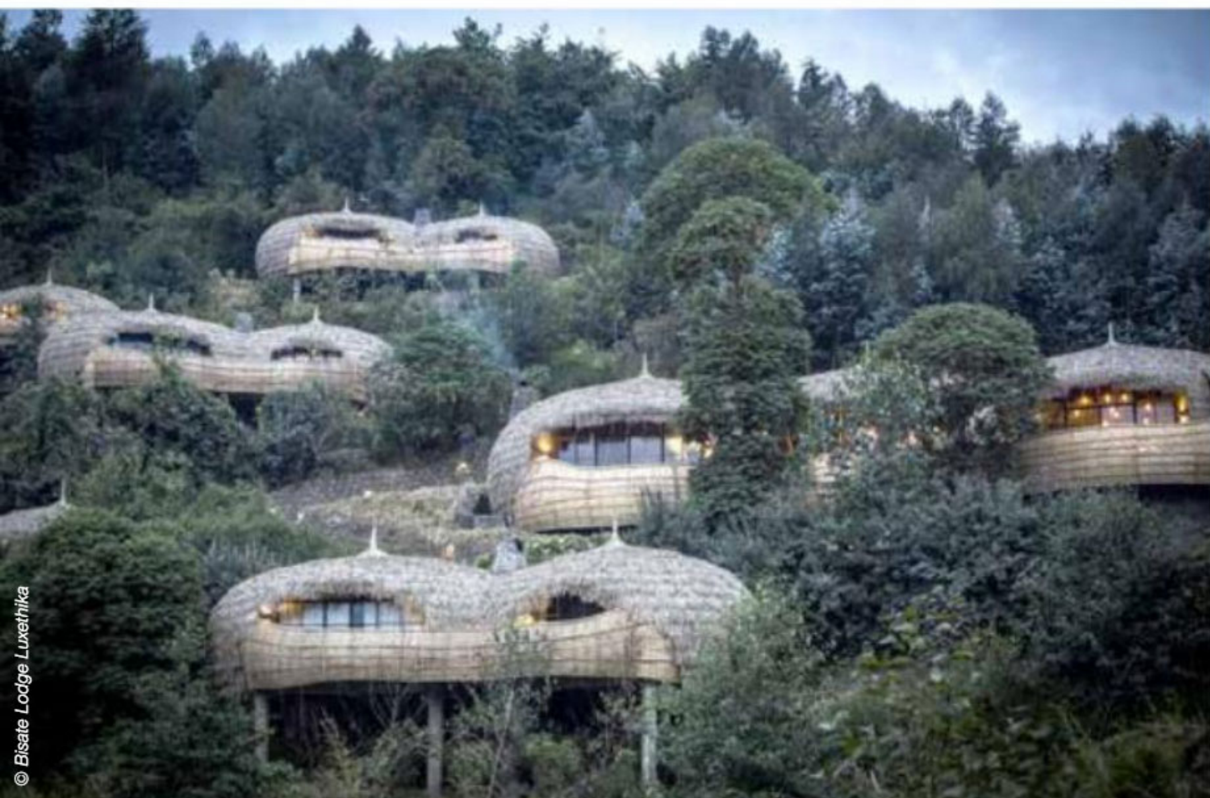
Cocons de fibre végétale émergeant de la jungle, les villas du Bisate Lodge s'inspirent des ondulations des collines rwandaises et s'intègrent harmonieusement à leur environnement.

Le continent africain compte parmi les dernières terres vierges où vivre d'extraordinaires aventures, loin des hordes de touristes et au contact d'une faune devenue rare. Escapade hors des sentiers battus, à la découverte de lodges d'exception.